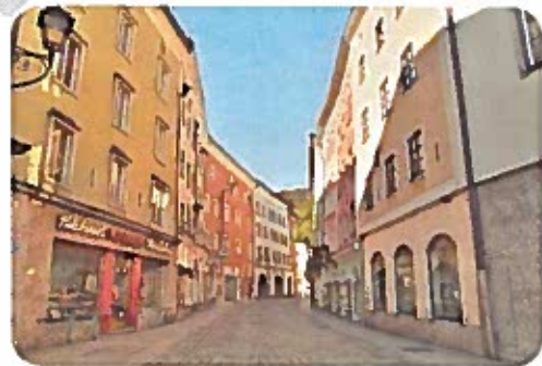
Gabriele aus Hallein (Text 2)