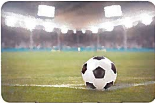
Larissa liebt Fussball (Text 1)