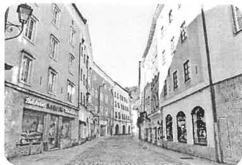
Gabriele aus Hallein (Text 2)