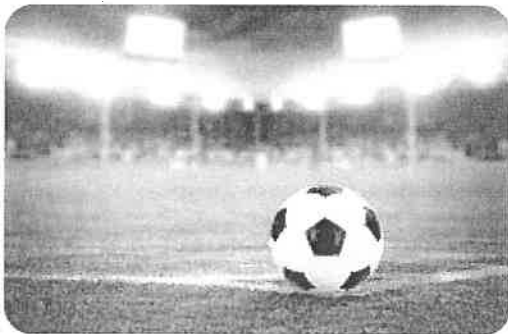
Larissa liebt Fussball (Text 1)