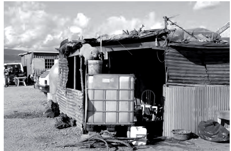
Fig. 6 – La macelleria del Gran Ghetto. Luglio 2013.

Un caso di marginalizzazione sociale che è forse utile rimanga invisibile ai molti per il beneficio di pochi.