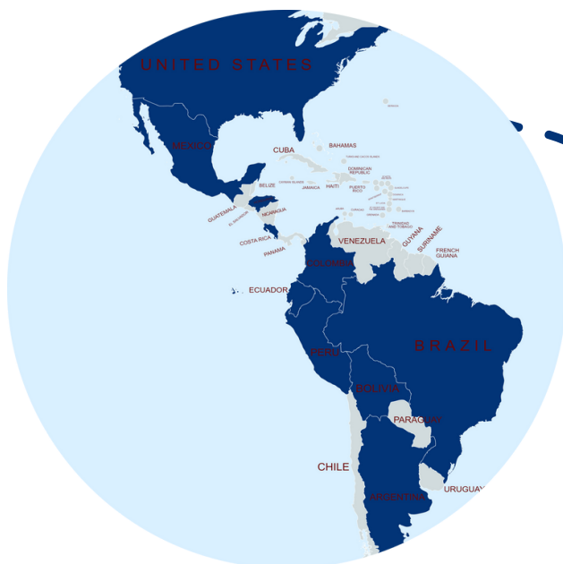
Amérique latine & États-Unis